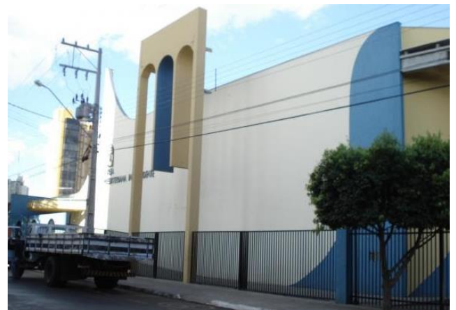
Igreja Presbiteriana Independente – IPI