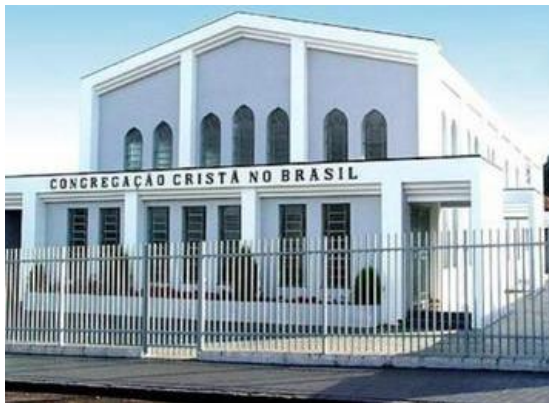
Congregação Cristã do Brasil