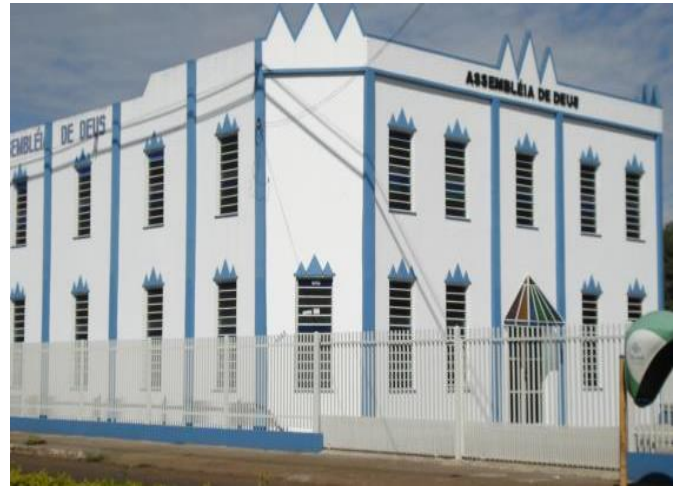
Assembleia de Deus

1- Qual desses locais sagrados você conhece?