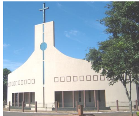
Igreja São Pedro Apóstolo e Nossa Senhora de Fátima