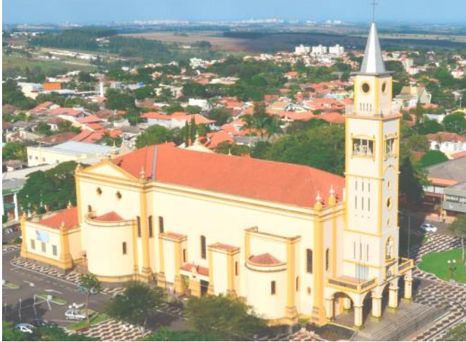
Igreja Matriz São José

Hoje vocês vão ver algumas imagens de locais sagrados aqui de nossa cidade.